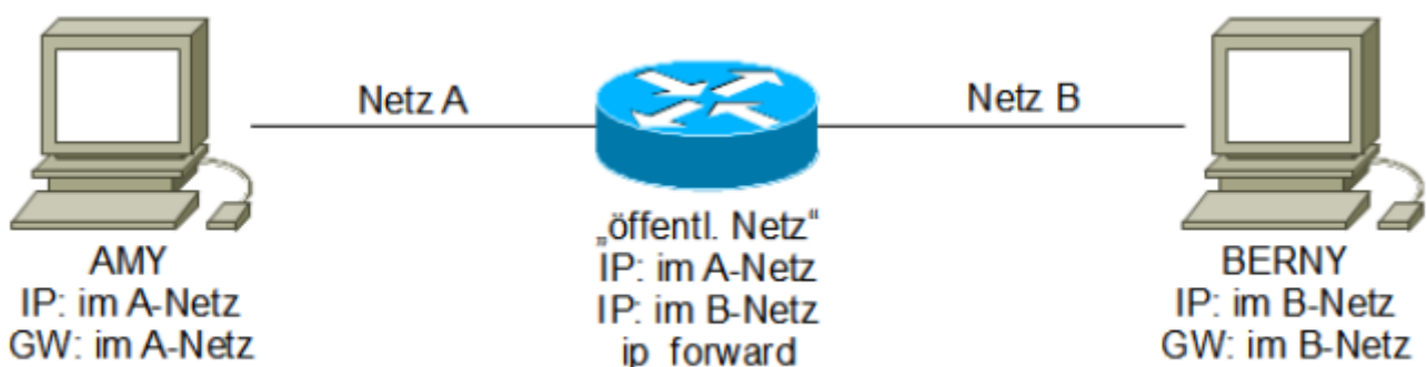
Abbildung 1: VPN: End-to-End im Transport-Modus (manuell konfiguriert)